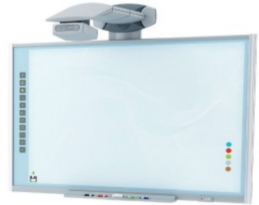
un tableau interactif